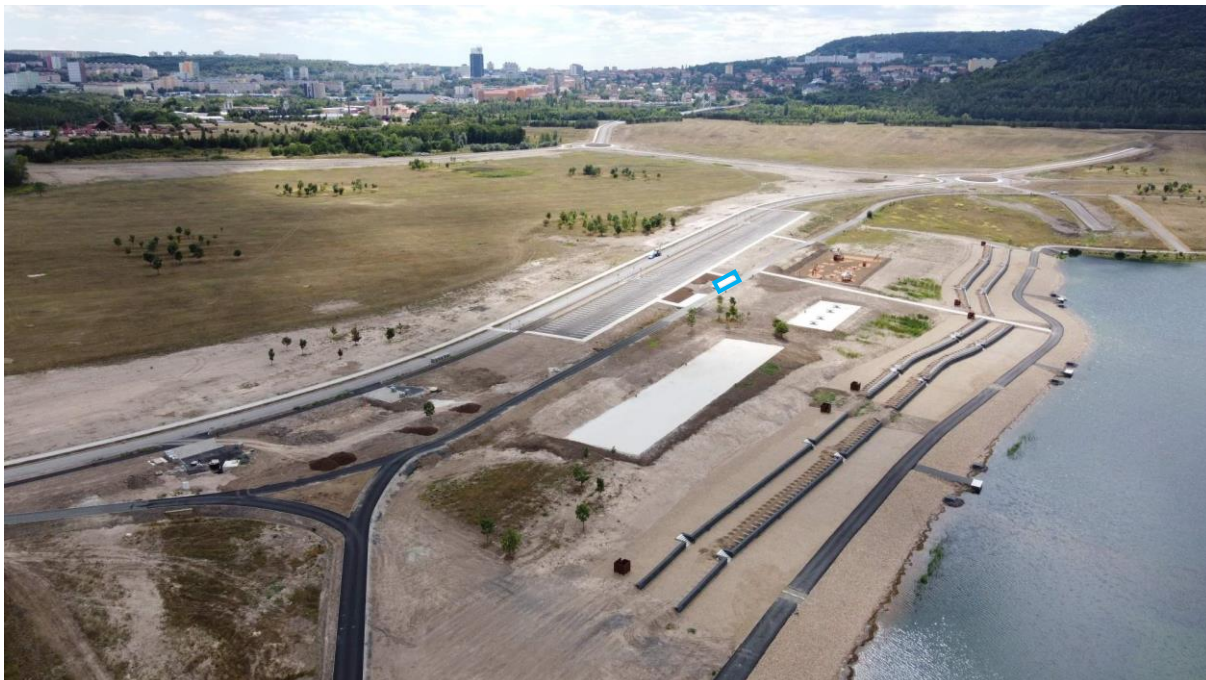
Příloha č. 2